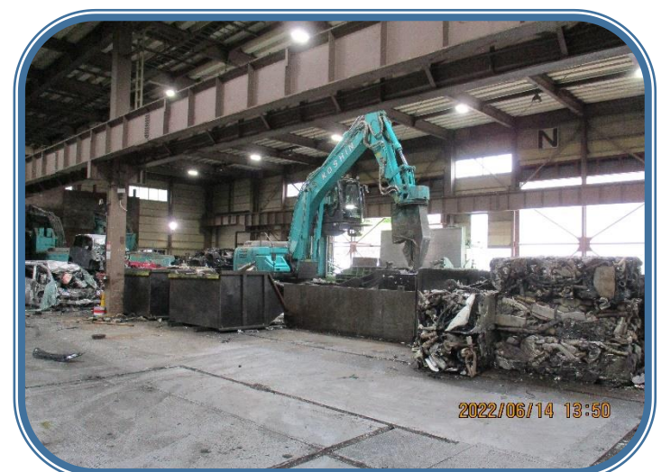
「オートパーツ光伸見学」 車を軽々と持ち上げ、小さくしていく作業は、まるで恐竜が働いているようでした。