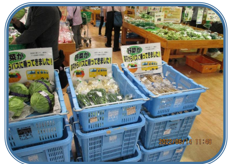
「パスカル三田見学」 店内を歩いていると「高平」のコーナーを発見。みんな喜んでいました。