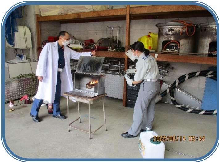
「三田消防署見学」 実験？油を温め続けるとどうなるか。油から炎が出ました。少し怖かったです。