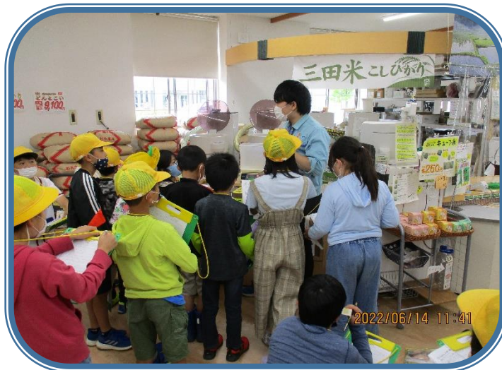
「パスカル三田見学」 野菜やお米、パン、お肉とたくさんの三田の特産物が並んでいました。