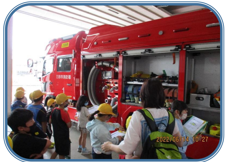
「三田消防署見学」 消防車の説明を聞きました。装備品の多さに驚きながらも、メモをとりました。