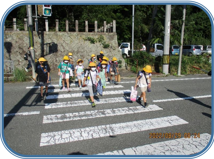
8月29日「朝の登校」 全校生 「おはようございます」の声で全校生が登校してきました。