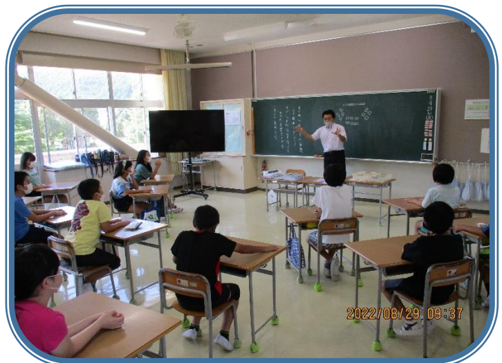
8月29日「席替え」 5年生 教室の座席配置を話し合い重視の型に変更していました。