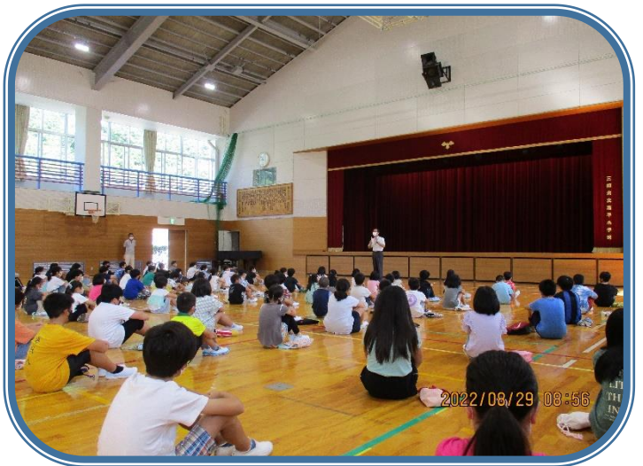
8月29日「始業式」 全校生 校長先生から「2学期を充実した学期にしましょう」