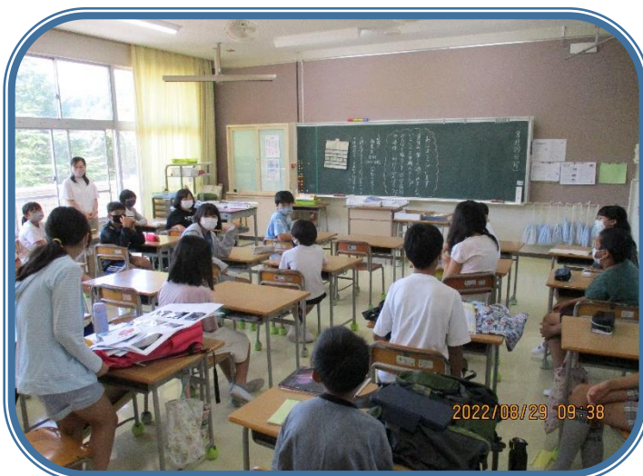
8月29日「夏休みの出来事」 6年生 夏休みの思い出を各自が楽しそうに発表していました。