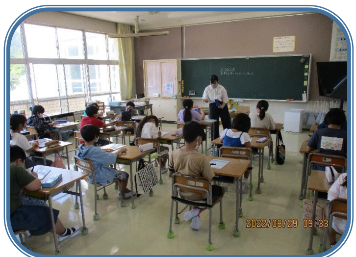
8月29日「夏休みの宿題」 4年生 夏休みの宿題、工作、自由研究を集めていきました。