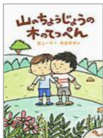
「山のちょうじょう の木でっぺん」 最上 一平 作 新日本出版社