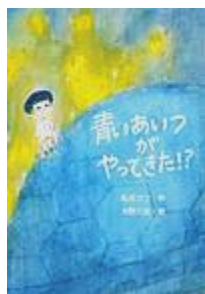
「青いあいつがやっ てきた!？」 松井 ラフ 作 文研出版