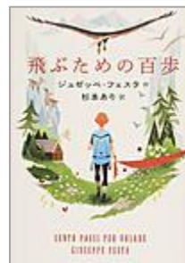
「飛ぶための百歩」 ジュゼッパ・フィタ 作 岩崎書店