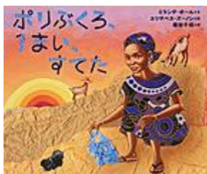
「ポリぶくろ、 1まい、すてた」 ミラダ・ポール 文 さ・え・ら書房