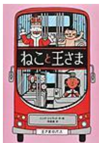
「ねこと王さま」 ニック・ジャラット 作・絵 徳間書店