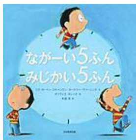
「ながーい5ふん みじかい5ふん」 リズ・ガートン・スキャロ文 光村教育図書