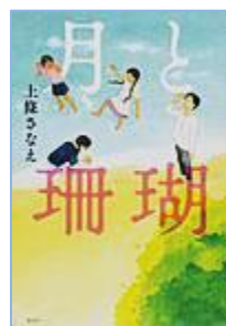
「月と珊瑚」 上條 さなえ 著 講談社