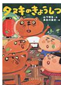
「タヌキの きょうしつ」 山下 明生 作 あかね書房