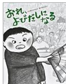
「おれ、 よびだしになる」 中川 ひろたか 文 アリス館