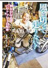
「風を切って走りた い! 夢をかなえる バリアフリー自転車」 高橋 うらら 著 金の星社