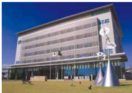
■三田市役所に対する信頼の程度について