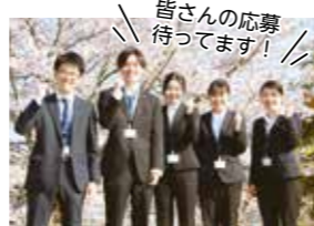
皆さんの応募お待ちしてます！

1次試験はSPI。Webや全国各地で受験可能！ 2次試験からは三田市で実施。軽装スタイル(ノージャケットなど)でOK！ ※募集の職種や要件などの詳細は市HP(下記2次元コード)をご覧ください。