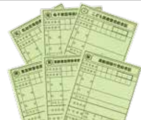
▲7月から使える新しい受給者証(うぐいす色)

新しい受給者証を、引き続き受給資格のある人へ6月下旬に郵送します。所得要件を満たさないなどの理由で受給資格のない人には更新できない旨の通知を送付します。