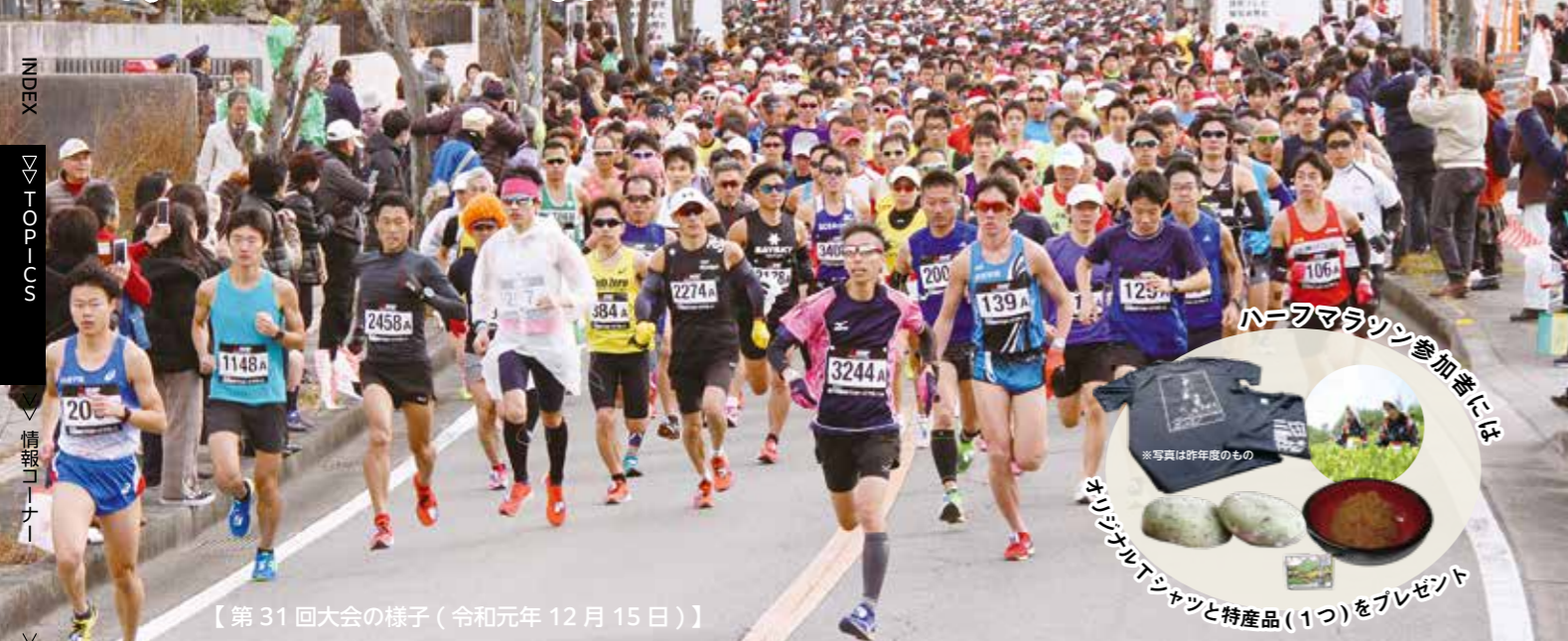
【第31回大会の様子(令和元年12月15日)】

今年は3大会ぶりのリアル開催!多くの皆さんに支えていただき、「三田の冬の風物詩」が復活します。「ハーフマラソンの部」に加え、小学生以上なら車いすでも参加できる「ファンランの部」もあります。市民のみなさんのあたたかい声援とおもてなしに包まれながら、師走の三田の名物コースを駆け抜けませんか。