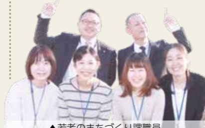
▲若者のまちづくり課職員