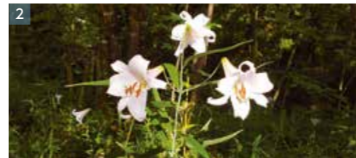
1. タイサンボク 2. ササユリ

大きな芝生広場だけでなく、里山の姿を残し、野生動物や四季折々の植物を楽しめる公園です。6月以降に見頃を迎えるのは、花や葉が大きくて探しやすい「タイサンボク」。香水の原料に使われており、落ちた花びら一枚を拾い、車に置くだけで幸せな気持ちになれる香り。また、白くて美しい花を咲かせる希少植物の「ササユリ」が見られるのも魅力の1つです。ぜひ、植物図鑑を片手に探索してみてください。