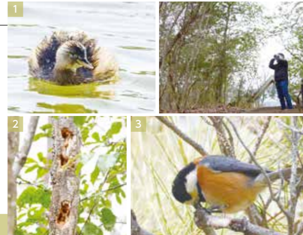
1. カイツブリ 2. キツツキが突いた跡 3. ヤマガラ

草地や林、水辺などさまざまな種類の野鳥が好む環境が整っている有馬富士公園。園内を歩けば20~30種類の野鳥に出会い、初めての人でも楽しめます！図鑑ではわからない野鳥の動きを観察するのが野鳥観察の醍醐味の一つ。木の実を割って必死に食べる姿はずっと見ても飽きません。有馬富士自然学習センターには図鑑もあるので、見た野鳥の色や特徴を伝えていただければ調べることもできます。特徴のある羽なら1枚から鳥の種類がわかることも！お気軽にお尋ねください！