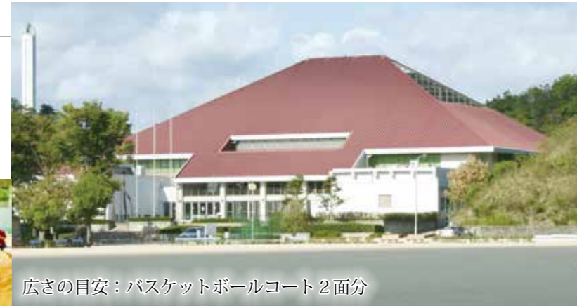
広さの目安：バスケットボールコート2面分