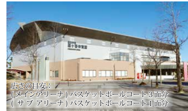
広さの目安： (メインアリーナ)バスケットボールコート3面分 (サブアリーナ)バスケットボールコート1面分