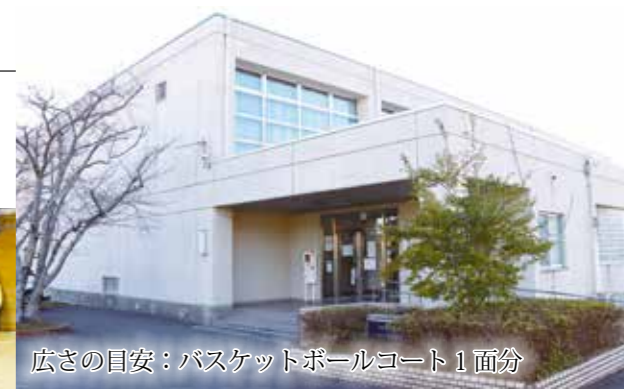
広さの目安：バスケットボールコート1面分