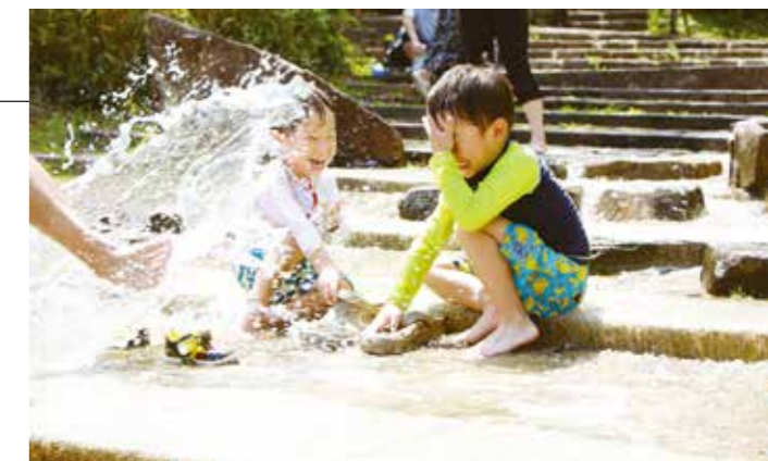
▲夏休み期間中(7月21日~8月28日)のみ水が流れます