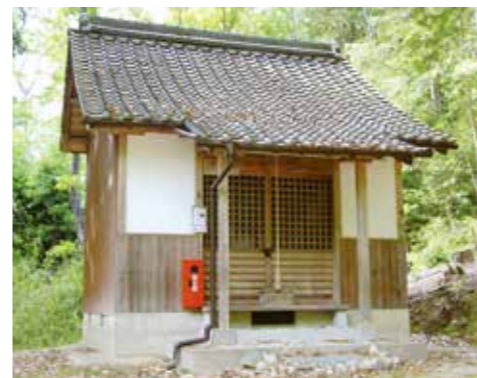
▲ 行基堂 (川除御霊神社内)

くあらずじ：奈良の大仏の建立にも関わった行基がこの地に来た時、洪水や水不足に悩む民衆のために、武庫川にせきを作るなど河川工事を行った。おかげで村人は水害から免れられるようになったとき。> この時に設けたせきが「松山の井(現在の消防本部近くにある交差点「松山堤」付近)。「川除」の地名は水害から免れる地域が起り、数々の社会事業に貢献した行基の恩を忘れぬようにと行基菩薩を祭る地域が多く、川除の行基堂もその1つ。堂内の行基像は日照りの時に持ち出し、武庫川で祈願すれば慈雨があると言われている。