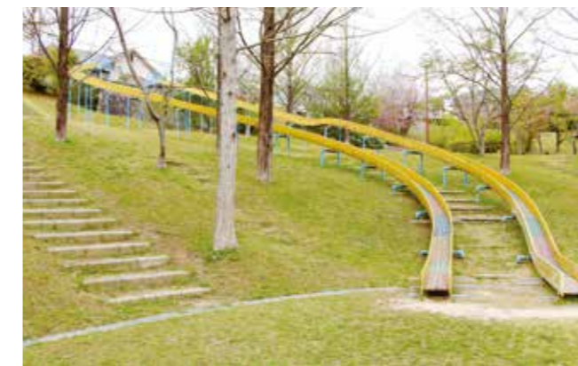
三田一遊具が多い「深田公園」 = 弥生が丘 =

園内には26の遊具があり、迷路で遊んだり、健康遊具で体を鍛えたり、ストレッチをしたり、幅広い年齢層の人が楽しめる公園です。昨年12月には滑り台をリニューアル！支柱の色は虹をイメージして七色に。滑り台についた起伏でスピードに緩急がついて楽しめます！