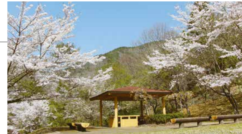
三田一標高が高い「奥山公園」 = 上本庄 =

三田市には子どもから大人まで楽しめる167の公園があります。今回はその中でも三田一〇〇な公園をご紹介します。皆さんも近くにある「三田一〇〇な公園」を探してみませんか。