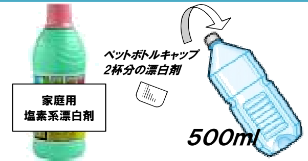
家庭用 塩素系漂白剤

おう吐物で汚れた床、衣類、おう吐物のふきとりに使ったぞうきんなどを、簡単な水洗いだけですませてはいけません。ウイルスが死滅せずに残っているため、乾燥後に空気中に飛び散り、この粒子を吸い込むことで感染する場合があります。