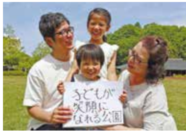
【掲載写真イメージ】

三田市の「今」を築いてきた皆さんだからこそ伝えられる「未来につなげたい三田市の魅力」をぜひお寄せください!大切な人と、三田市で過ごす今を記念に残しませんか。