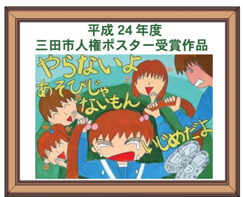
平成 24 年度 三田市人権ポスター受賞作品